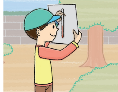
1日の気温 (4月22日調べ)

下の表は、こうきさんが 調べた1日の気温です。 これを折れ線グラフに かいてみましょう。