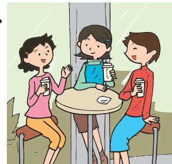
talking with my friends