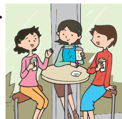
talking with my friends